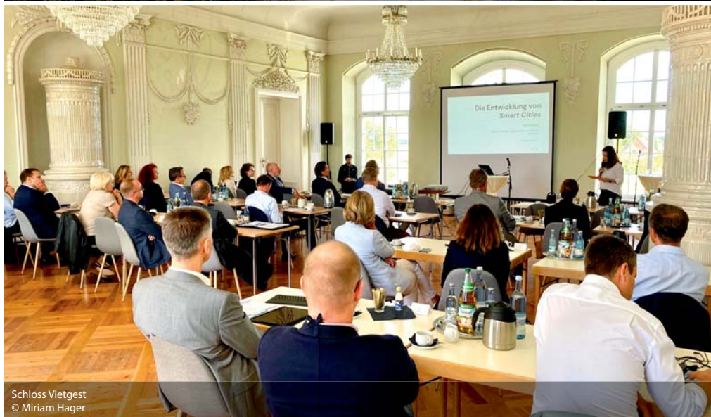
Schloss Vietgest