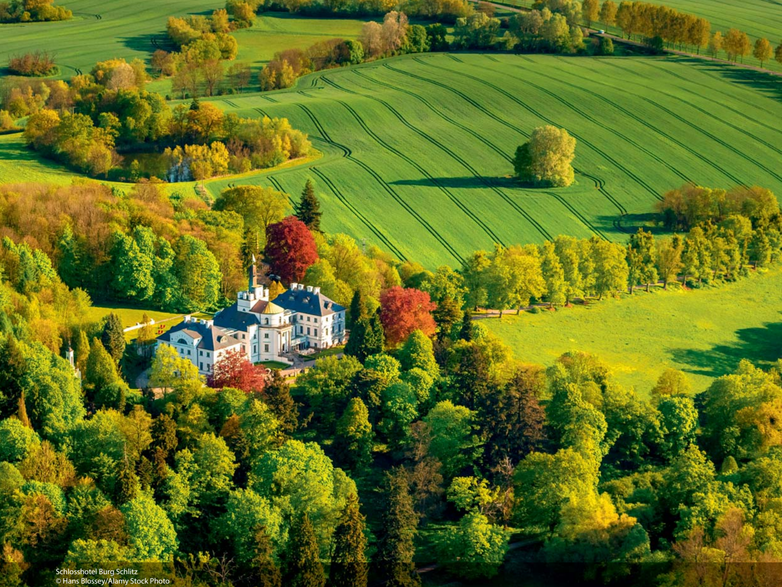
Schlosshotel Burg Schlitz