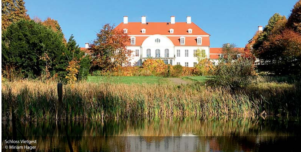
Schloss Vietgest

In der Abgeschiedenheit kann man ungestört und konzentriert arbeiten. Genau das ist in Duckwitz möglich, da, wo es weniger als 40 Einwohner gibt – dafür umso mehr Pferde und Natur. Vor allem die Kreativität wird hier in der Stille der Land-